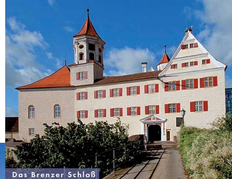
Das Brenzer Schloß